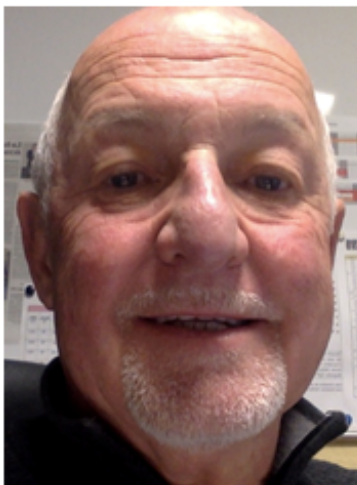
Le Président de la Ligue FSGT Alpes Méditerranée |

Bonne course, bonne confrontation et bonne performance à tous.